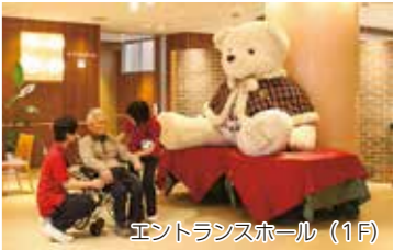
エントランスホール（1F）