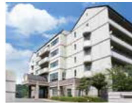
ドリームガーデン倉敷