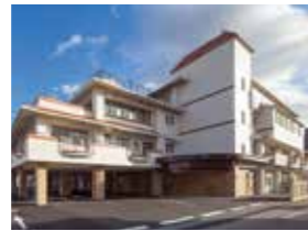
ピースガーデン倉敷

訪問看護・訪問介護・鍼灸院 予防リハ・通所リハ・ショート ケアプラン室・地域包括センター