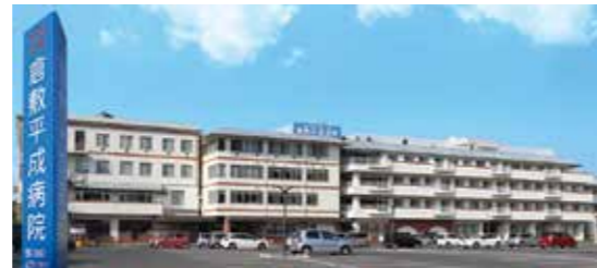
倉敷平成病院 [救急指定]

脳神経外科・神経内科・整形外科など全22科。220床を運営。 (グランドガーデン南町より西へ車で3分) 協力医療機関