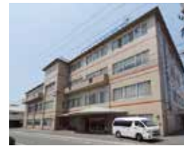
倉敷在宅総合ケアセンター

訪問看護・訪問介護・鍼灸院 予防リハ・通所リハ・ショート ケアプラン室・地域包括センター