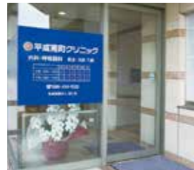
平成南町クリニック