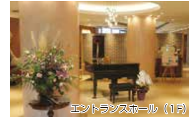
エントランスホール（1F）