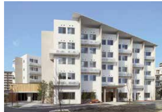
グランドガーデン南町

予防・医療・福祉の連携、ケアの連続を誇る全仁会グループから誕生した サービス付き高齢者向け住宅「グランドガーデン南町」