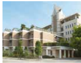
ローズガーデン倉敷