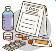
表1 誤飲・異食時対応早見表