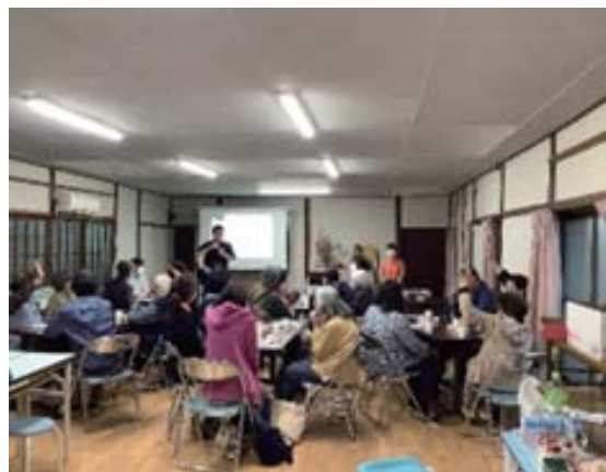
2025年10月31日 川西町連合集会所にて開催

高齢者支援センターでは、地域の方が気軽に繋がることができる「集いの場」を大切にしています。今後も企画していきますので、ぜひお気軽にご参加ください。